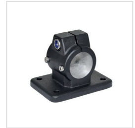
2 Kennziffer 2 mit Edelstahl-Klemmschraube DIN 912