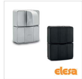
ELESA original design BMST