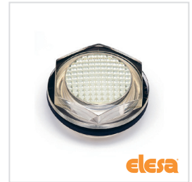
ELESA original design HFTX-PR/HFTR-PR