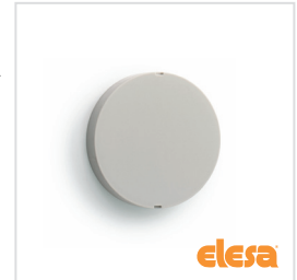
ELESA Original design CP.