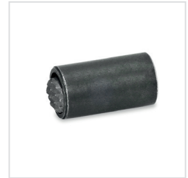
Anwendungsbeispiel verschiedener Pendelelemente mit O-Ring