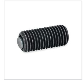
Anwendungsbeispiel verschiedener Pendelelemente mit O-Ring