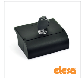
ELESA original design ESC